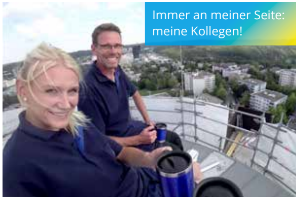
Immer an meiner Seite: meine Kollegen!