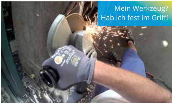
Mein Werkzeug? Hab ich fest im Griff!