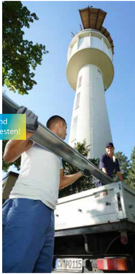
Hand in Hand geht's am besten!