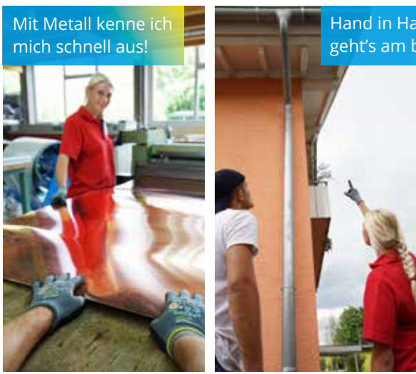
Mit Metall kenne ich mich schnell aus!