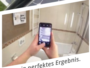
... für ein perfektes Ergebnis.