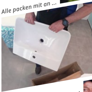
Alle packen mit an ...