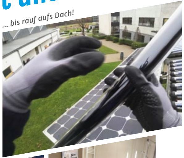
... bis rauf aufs Dach!