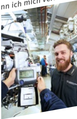
Auf meine Messgeräte kann ich mich verlassen!