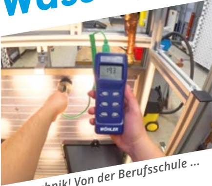
Solartechnik! Von der Berufsschule ...